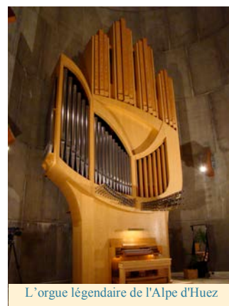
L'orgue légendaire de l'Alpe d'Huez

Dans le domaine de la facture d'orgue, l'originalité de ses réflexions et la pertinence de ses idées se mesurent à l'aune des instruments novateurs qu'il a conçus, notamment dans les églises de l'Alpe d'Huez (par Detlev Kleuker), Notre-Dame-des-Grâces, au Chant d'Oiseau à